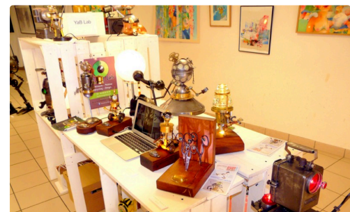
LE YAB LAB