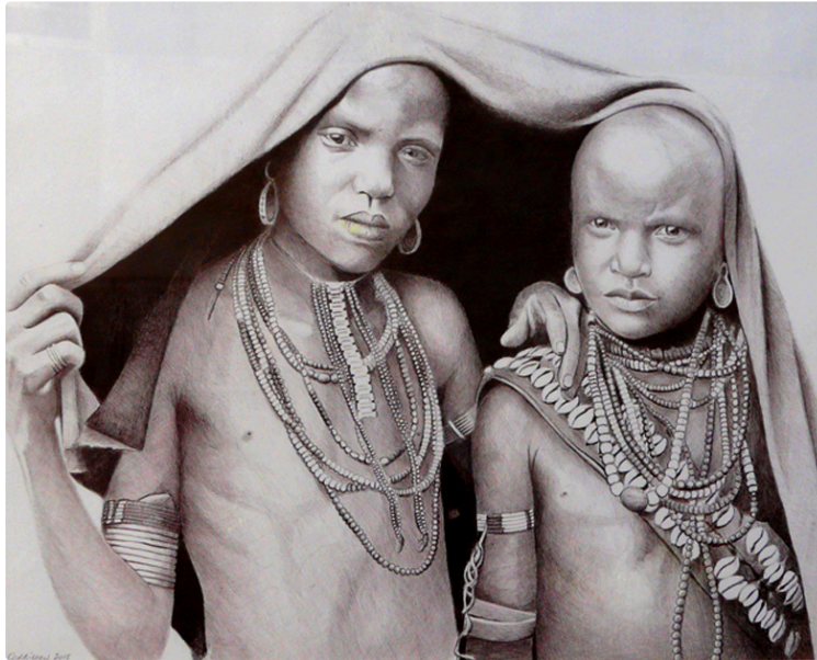
LA ROMIEU: Du soleil pour les artistes

C'est sous un soleil radieux que les amateurs d'art ont parcouru, samedi et dimanche, la place BOUET, le cloître de la collégiale, et visiter des domiciles pour rencontrer les artistes et admirer leurs œuvres. Tous les styles étaient représentés mais comme l'année dernière deux « coups de cœur » qui n'engagent que leur auteur en l'occurrence moi.