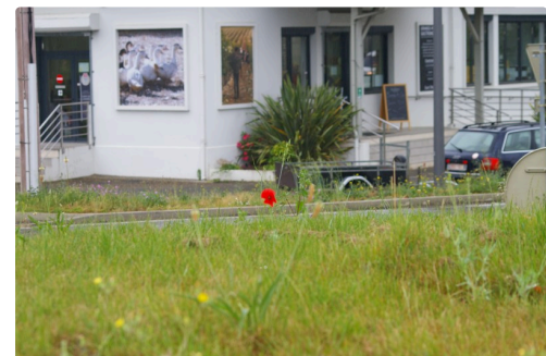
Preuve qu'il est bien à cet endroit : Photos Marcel Lavedan : N B Les photos présentées ici ou ailleurs sont la propriété exclusive de leur auteur et de leurs ayants droits aux termes des articles L 111-1 et L 112-1 du code de la propriété intellectuelle . Toute reproduction diffusion, publique ou à usage commercial sont interdits sans autorisation du titulaire des droits