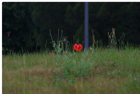
Le décor aujourd'hui un coquelicot au milieu des herbes folles