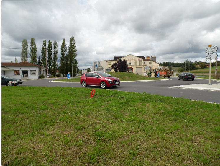
Giratoire de "Bonnet" à Lasserrade

Le projet d'animation publicitaire serait peut être relancé