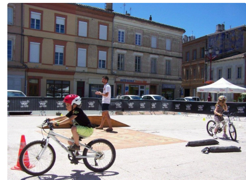
Toujours des intrépides sur le parcours d'obstacles