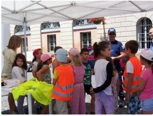
Des explications sur la sécurité par la Police Municipale de l'Isle-Jourdain