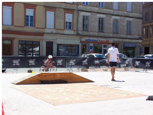
Un petit tremplin et des obstacles, un jeu distrayant pour les jeunes...