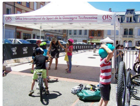
Le port du casque est obligatoire