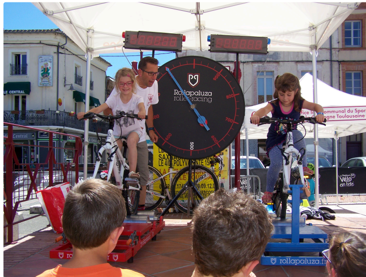
Le vélo en fête à l'Isle-Jourdain