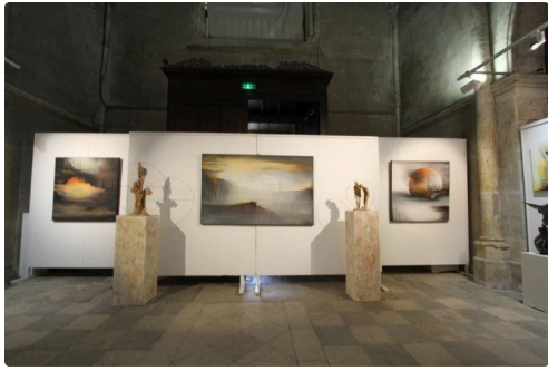
Chaque peinture de Jean-Jacques Lantourne est une quête de sérénité.