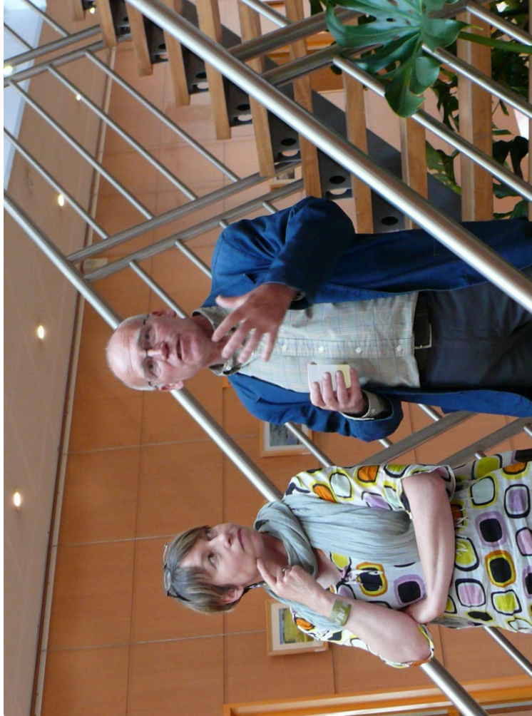
Jusqu'au 22 juin au Malartic à Auch dans le hall d'entrée du Crédit Agricole deux peintres gersois exposent leurs toiles.

Photo : Christelle Debord et Serge Delfau ont dévoilé leurs parcours de peintre