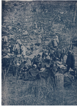
Un moment de repos sur le front de l'Aisne Illustration extraite de la collection « Le Panorama de la Guerre » de Taillandier.