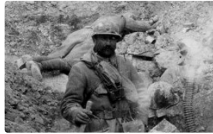
Il y a cent ans : 1917, des Gersois sur le Chemin des Dames

À l'occasion du centenaire de la Première Guerre Mondiale, la Société archéologique du Gers et les écrivains publics du Gers se sont associés pour vous faire découvrir la chronologie des événements marquants de la Grande Guerre, tels qu'ils ont été vécus par les Gersois, au travers des grandes batailles qui l'ont émaillée. Chacun d'eux sera l'occasion d'un article qui en reprendra les grandes lignes et s'appuiera sur des portraits d'hommes, soldats gersois, morts ou disparus. L'idée de cette série est de leur rendre hommage pour, qu'à travers eux, le sacrifice de tous ceux de 14 ne soit pas emporté par l'oubli, même cent ans après.