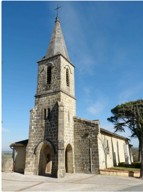
L'église St Jacques de Lasseran