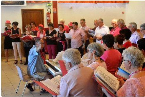
l'Ensemble vocal Mèl-i Mèl-o