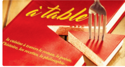
Lecture - Festival Rencontres en lecture

Le 3ème Festival Rencontres en Lectures aura lieu à Lectoure du 30 juin au 2 juillet, autour du thème : "A table!", la cuisine à travers le roman, la poésie, l'histoire, les recettes, la philosophie.