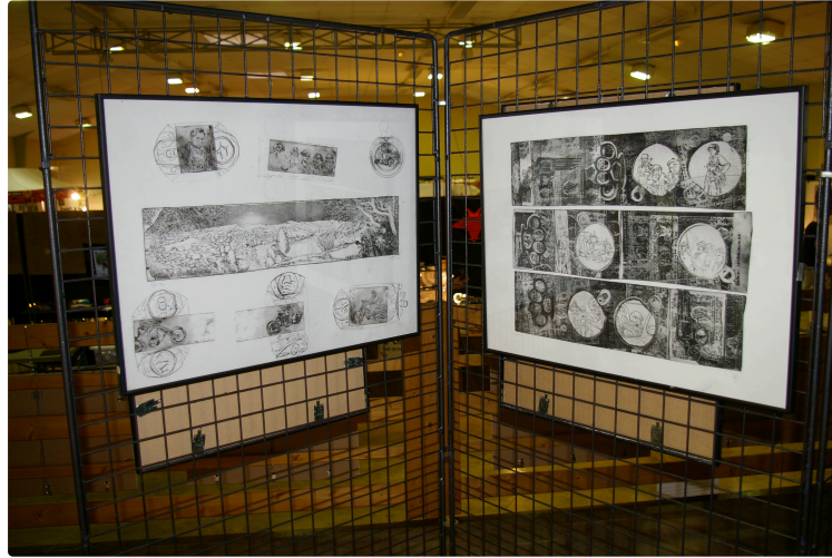
Le bilan du vingt cinquième salon des métiers d'art

La fréquentation plombée par la chaleur n'a pas empêché les bonnes affaires