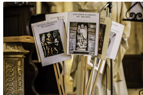
Les panonceaux sont rangés