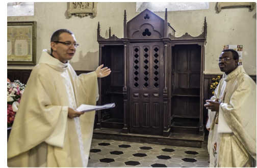
... le confessionnal...