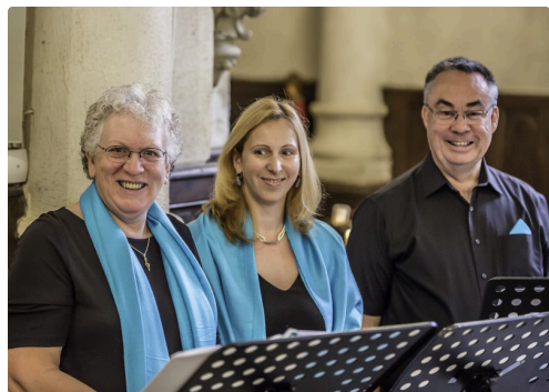
Le brain trust de la chorale

(1) La paroisse est composée des villages d'Aignan, Bouzon-Gellenave, Castelnavet, Fustérouau, Loussous-Débat, Margouët-Meymes et Sabazan. (2) Jean 17 1b-2a. (3) La vie éternelle, c'est qu'ils Te connaissent, Toi le seul vrai Dieu et celui que Tu as envoyé, Jésus-Christ ».