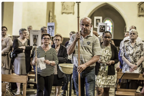
Le cortège avec les panonceaux des églises