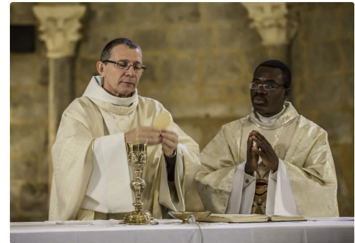
Consécration du pain