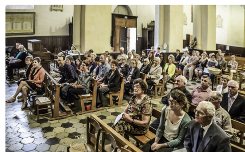
Autre vue de l'assemblée