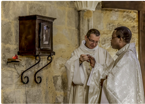
... remise des clefs du tabernacle