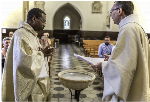
Le tour de l'église : le baptistère...