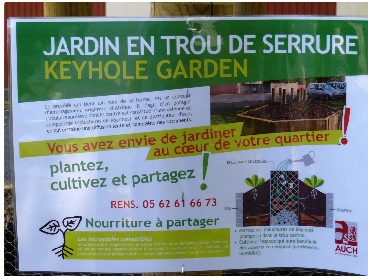
AUCH : les jardins en trou de serrure.