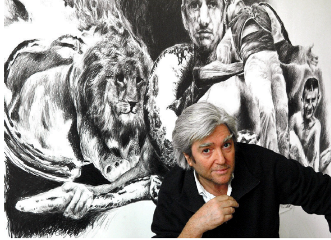
Chambas : dessiner, peindre...50 ans

Vic-Fezensac s'apprête à accueillir l'enfant du pays pour une vaste exposition d'une tournée itinérante