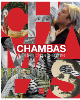
Couverture du livre Chambas