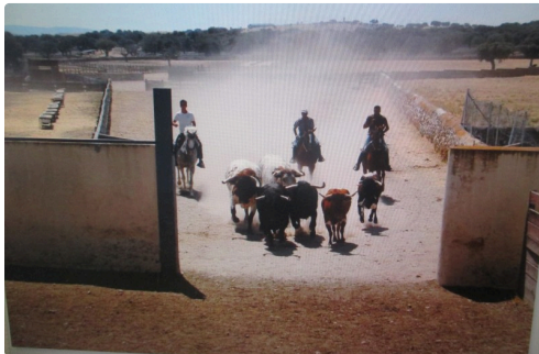
Rassemblement des toros avant l'embarquement

Cinco de la tarde .. au palco se lève un homme costumé et cravaté, il agite un mouchoir blanc, et tout s'agite dans le patio de toreros c'est le Président. Il a été choisi par le club parmi les aficionados dont on connaît les connaissances de la taumachie. En France pas de règlement officiel, on suit celui d'Espagne, pour s'y référer quand c'est favorable et l'ignorer lorsqu'il est gênant. Le président est le véritable patron de la corrida, il est accompagné de deux assesseurs avec lesquels il discutera lors des moments essentiels de la lidia, tercio de piques et attribution des trophées. Ce jury doit suivre avec attention l'action des picadors et décider le nombre de piques en fonction de la force du toro, bien analyser le comportement du toro sous les puyas, pour lui permettre d'être présent dans le tercio de muleta. L'après midi ne sera pas de tout repos, il faut compter aussi sur le public qui se veut être juge également. La panoplie du président est composée de 4 mouchoirs : un blanc pour diriger les changements de tercio et attribuer les récompenses, vert pour ordonner le retrait, rouge pour imposer la pose de banderilles à un toro qui refuse le combat et un bleu pour donner à la dépouille du toro un tour d'honneur pour les qualités exceptionnelles dans la lidia. L'attribution des oreilles est un moment fort pour les titulaires du palco, une, deux, aucune.