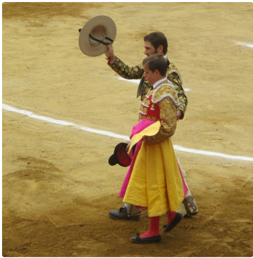
Vuelta donnée par la présidence à un toréro et un picador