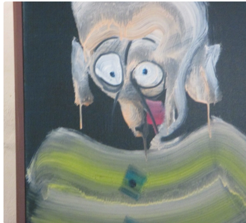
Peinture de Tastet à la galerie de la Sonrisa