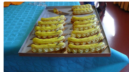
Les éclairs réalisés par Mariana Santos-Félizardo.