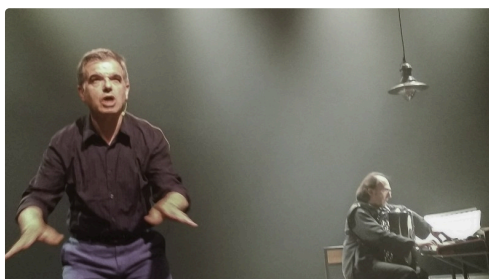
Christian Laborde en scène