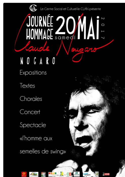
Affiche de l'hommage à Claude Nougaro