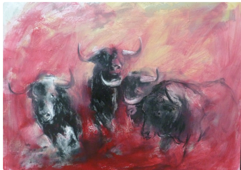
Taureaux au campo d'Yves Duffour

SEPT PECHES CAPITEU X - vernissage 13 h - Dessins de Jy et surprises dans le patio