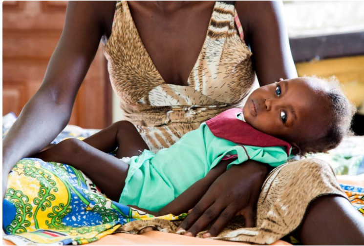
UNICEF : Des concert contre la famine