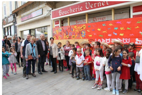
Première devanture posée