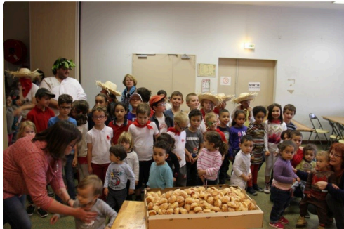
Un goûter attendait les écoliers

Les élèves ont été remerciés par le Président des Bandas et le Maire de Condom, un goûter leur a été offert.