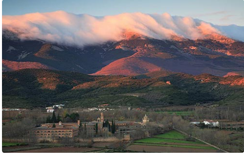
CAMPO de BORJA