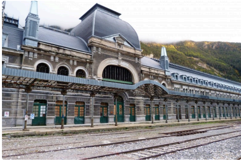
La célèbre gare de CANFRANC