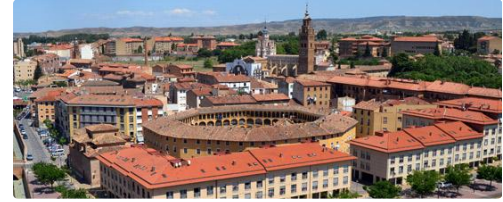
La ville de TARAZONA