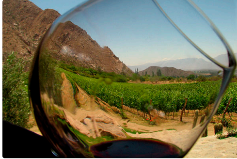
el vino campo de borja