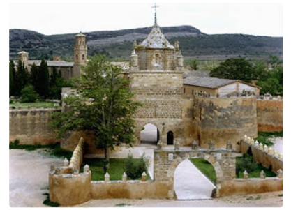
Monastère de VERUELA