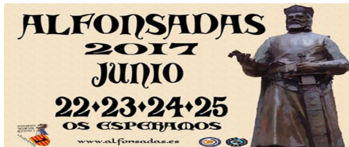
Allez voir les ALFONSADAS à CALATAYUD.