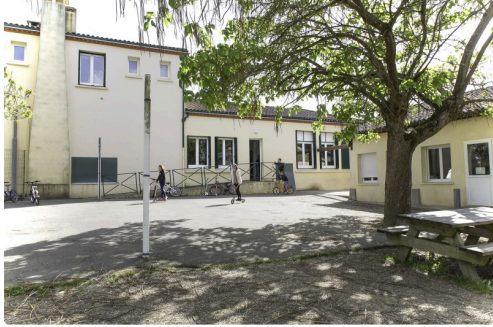
La cour de l'école