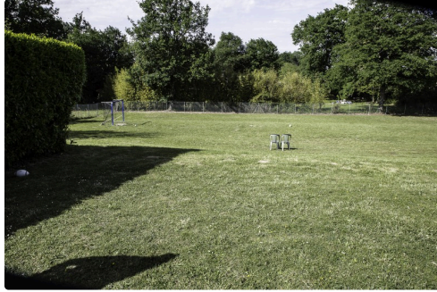
Le magnifique jardin de récréation attenant