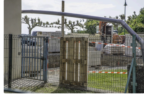
Le chantier de la cuisine, des sanitaires et de la cantine ont démarré