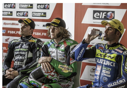
Le podium des 3 challengers SBK après la course 2