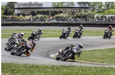
Honda 2 Castan 1er, Chapeau 2e