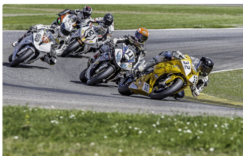
European Bikes 2, Brunet-Lugardon 2e, Amalric 1er, Gabrielian 4e