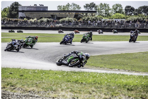
SBK 1 1er tour