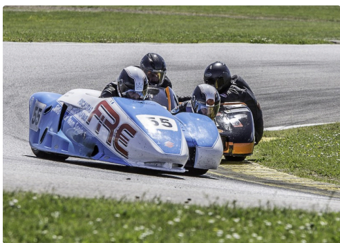
Side-car 1 Cela coince