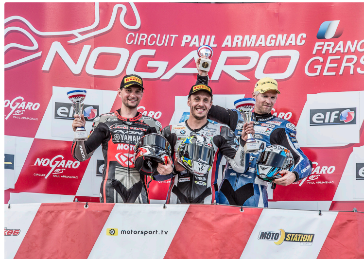
Nogaro – Festival moto Superbike

Ce dimanche 6 mai, la Fédération française motocycliste et les pilotes ont montré le meilleur. Les 6 catégories de machines offraient un super-plateau. Les spectateurs - grâce aussi à l'excellente météo - sont venus en foule, plus que la veille. Il y a eu 15 443 spectateurs cette année, contre 13 640 en 2016, soit 13,22 % d'augmentation. Outre la bonne météo, un autre motif de satisfaction a pu jouer : les motards spectateurs ont pu garer leur moto à l'intérieur de l'enceinte du circuit, ce qui les mettait plus directement à même d'arpenter le paddock.