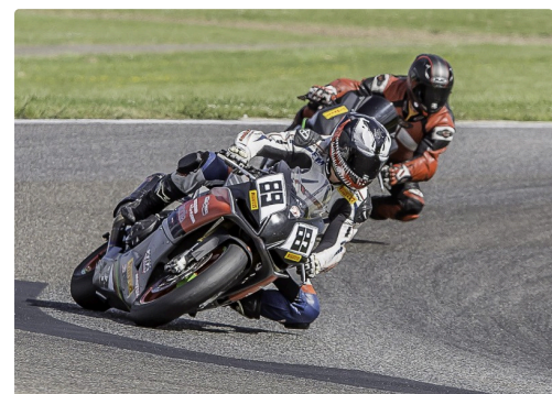
European Bikes 2, Derieux 17e