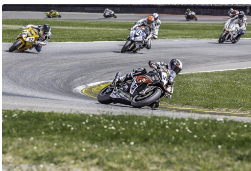
European Bikes 2, Brun 24e, Brunet-Lugardon, 2e Amalric 1er