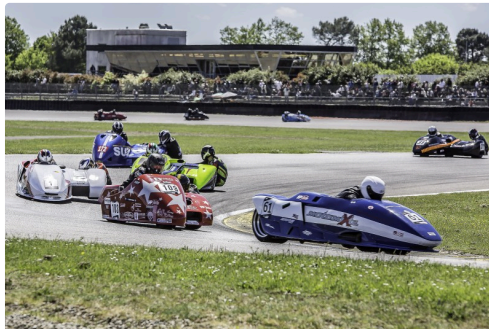
Side-car 1 Le peloton 4e