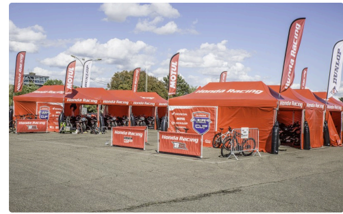
Les chapiteaux Honda