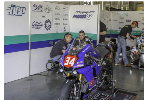
Chez Team OCP