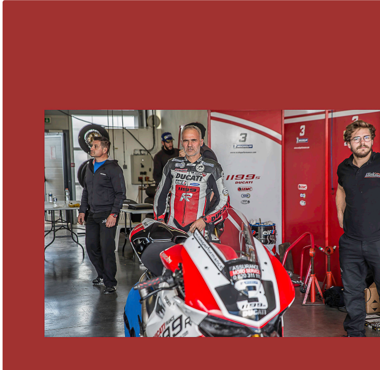
Nogaro – À la veille du grand jour des courses SBK

C'est demain dimanche la grande journée de courses sur le circuit Paul-Armagnac. Comme Le Journal du Gers l'avait annoncé, il y a eu ce samedi 6 mai quelques courses, mais surtout des essais chrono. On en a profité pour faire le tour des stands et des deux paddocks pour vous montrer les pilotes, leurs mécanos et leur coachs dans l'intimité. On a été très bien accueilli.