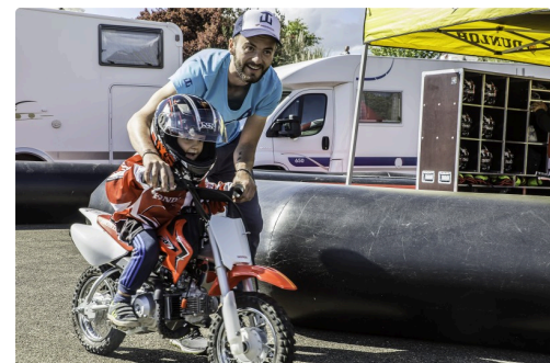
Un gamin émerveillé