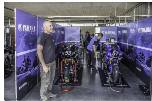
Encore chez Yamaha