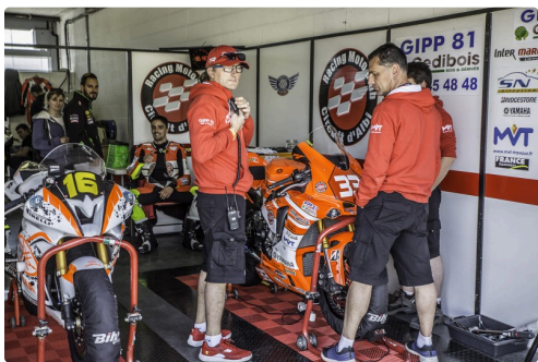
Chez Gipp 81