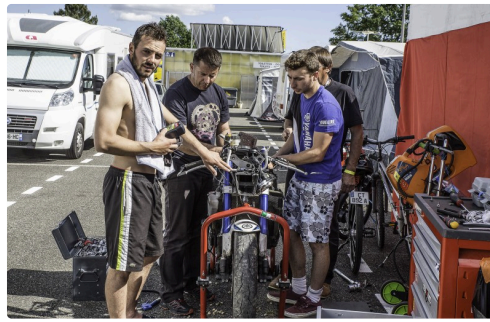
Ici on travaille en plein air