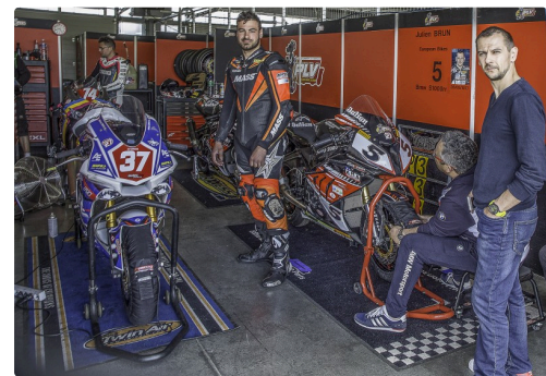
Chez PLV avec BMW