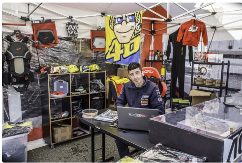
Magasin d'accessoires moto