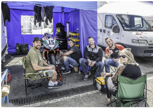
Un bon accueil