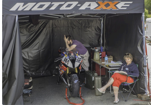
La tente de Moto-Axe