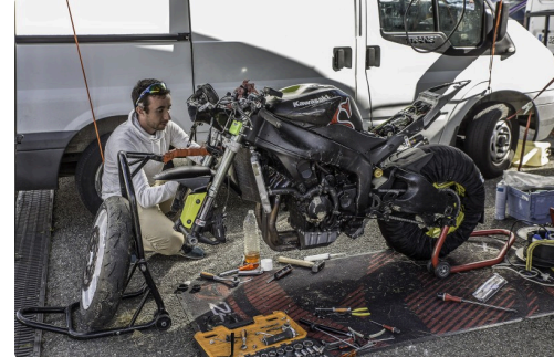
Une révision complète