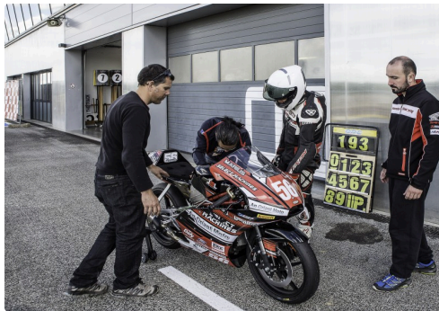
Derniers réglages pour les essais