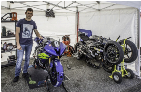
Une autre tente où l'on travaille