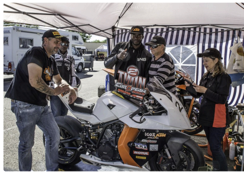
Ici aussi on travaille en plein air