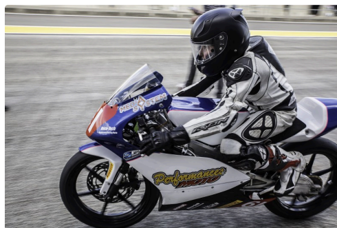
...il est parti