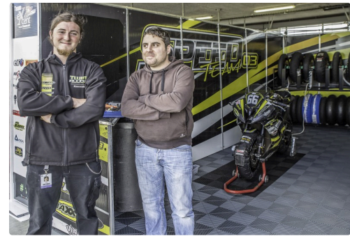
Chez Speed Team