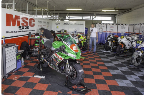
Chez MSC 93