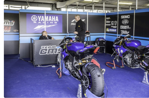
Chez Team GMS