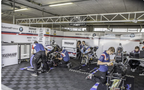
Chez Tecmas Racing Team