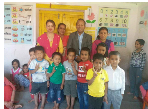
la rentrée dans des locaux rénovés à Gers-Himalaya-School