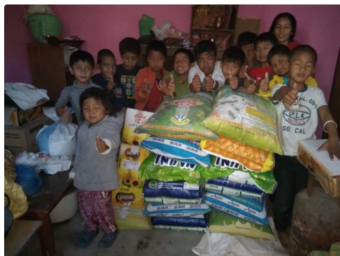
les enfants de Phutung ont reçu l'aide matérielle de Gers-Himalaya

Beaucoup reste à faire, mais gageons qu'avec le soutien précieux des différentes ONG, la nouvelle année scolaire qui commence maintenant témoignera d'un renouveau pour ce magnifique pays himalayen. Lors de notre assemblée générale le 10 juin prochain, nous parlerons de l'avenir et des projets à mener.