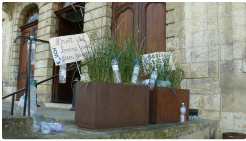
Des bouteilles à l'entrée de la mairie ...