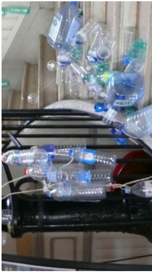
Et dans l'escalier qui monte à la salle des illustres.