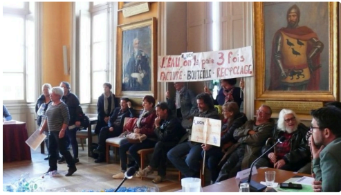
Le groupe des manifestants des Amis de la Terre et d'EAuch bien commun.