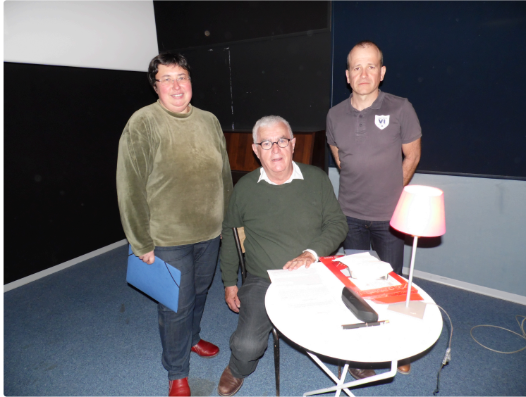
Conférence de "La Mésange Bleue"

L'église de Plaisance présentée au cinéma l'Europe