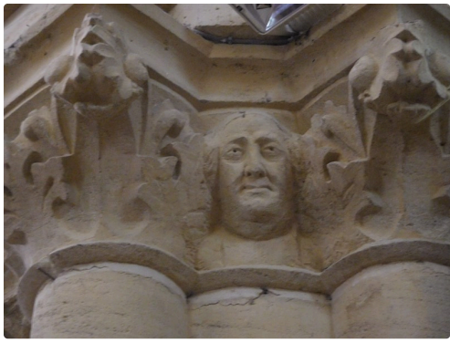
Un des prêtres batisseurs