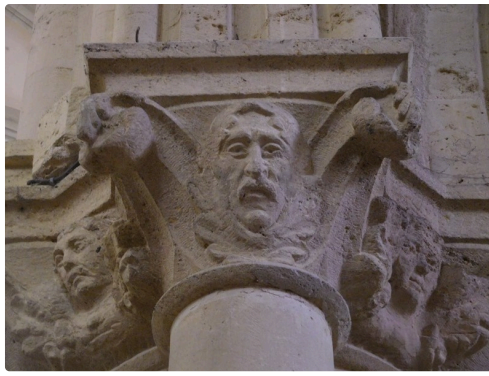
Un des patriarches de Plaisance