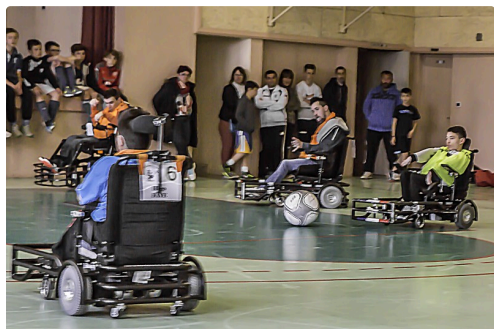
Phase de jeu