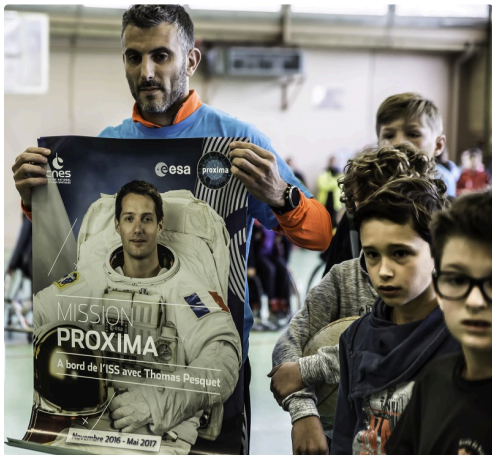
Affiche de la mission de Thomas Pesquet