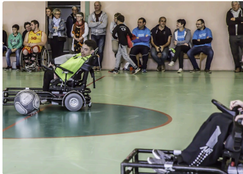
Encore un shoot