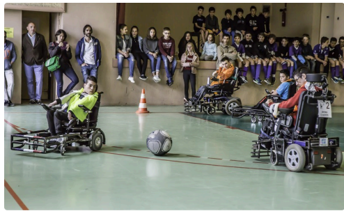
1/4 de tour à gauche et shoot