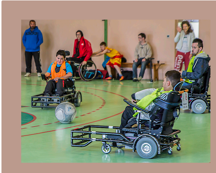
Laujuzan – Journée de sport en commun handi - valides