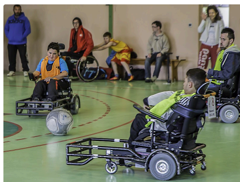
Phase de la démonstration de foot fauteuil