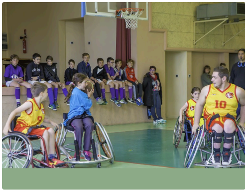
Basket fauteuil handicapés et valides