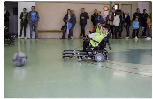
Nouveau shoot et nouveau but