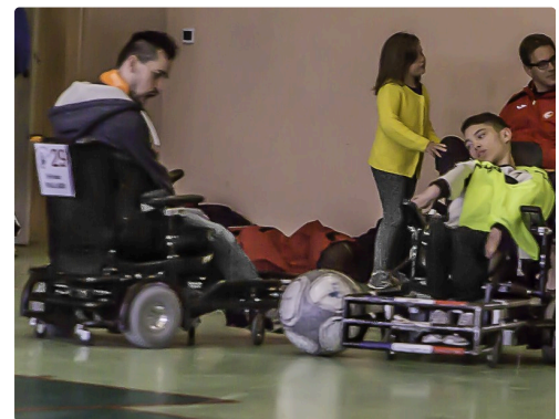
Phase de jeu