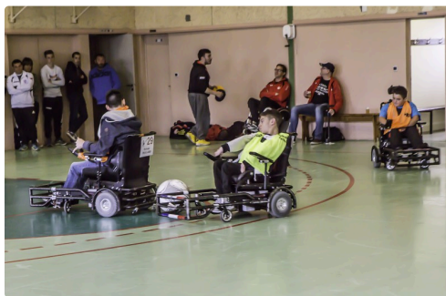
Phase de jeu