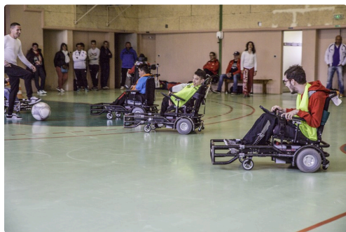
L'arbitre reprend la balle