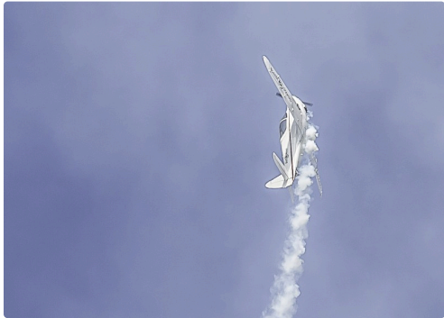
Séquence patrouille Swift