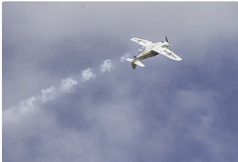
Séquence patrouille Swift