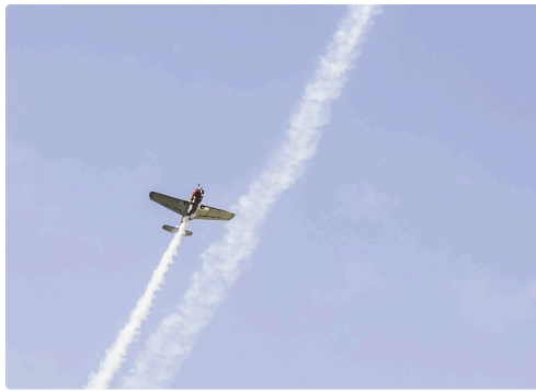
Séquence patrouille Swift