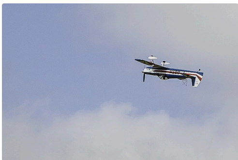
Séquence du Cap21