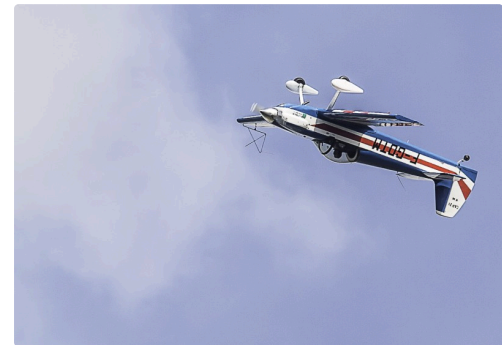
Séquence du Cap21