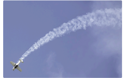
Séquence patrouille Swift