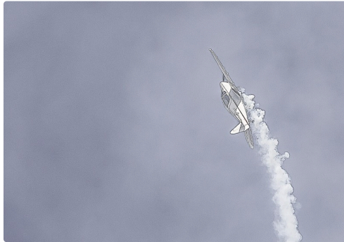
Séquence patrouille Swift