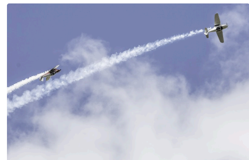
Séquence patrouille Swift