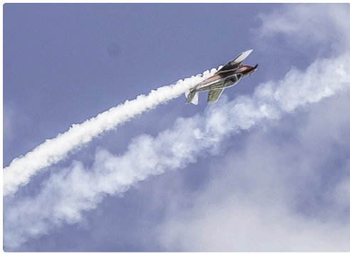
Séquence patrouille Swift - Gros plan sur l'avion le plus bas