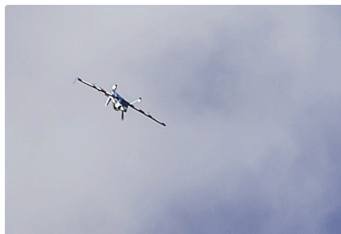
Séquence du Cap21