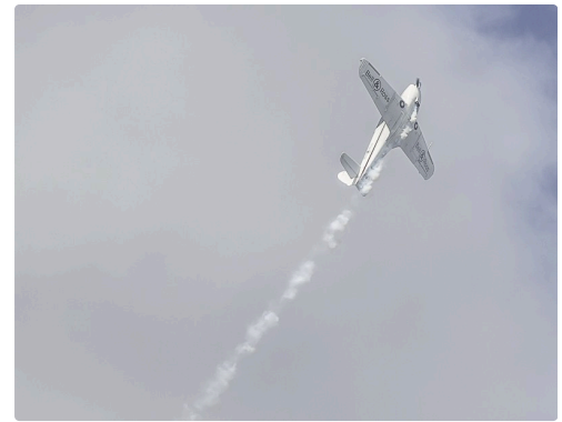
Séquence patrouille Swift