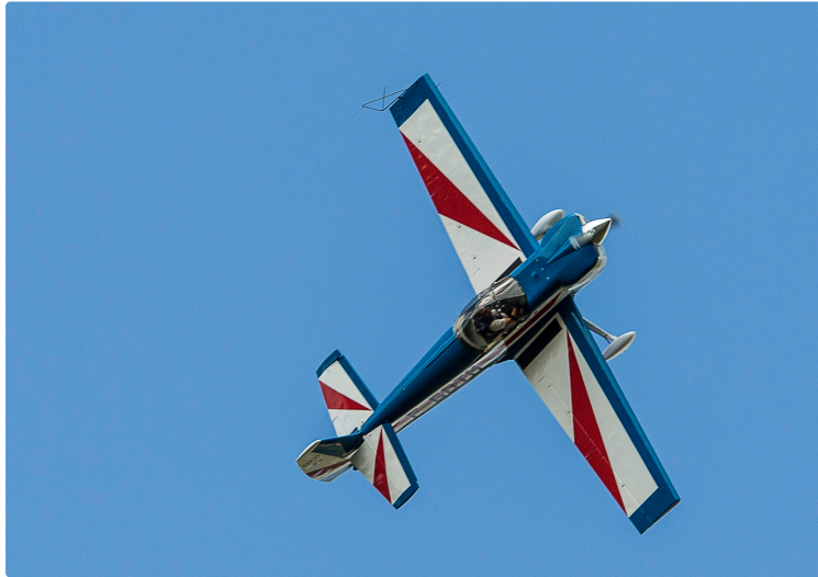
Nogaro – Voltige aérienne pour les Coupes de Pâques

Avec leurs avions à hélice, trois pilotes ont fait de la voltige pendant un quart d'heure au-dessus de l'aérodrome de l'aéro-club de Nogaro ce dimanche de Pâques. Vols sur le dos, loopings, descente en feuille morte à la limite de la vrille, montée en chandelle et évolution d'ensemble : ils en ont mis plein la vue - entre deux courses de voitures - aux nombreux spectateurs venus au circuit de Nogaro pour les Coupes de Pâques.