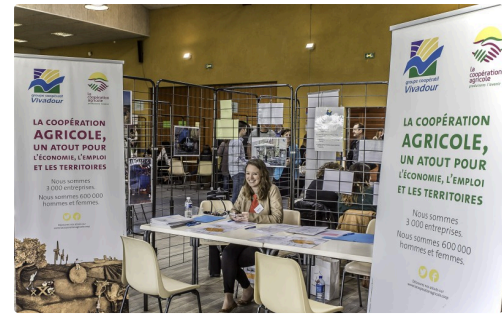
Stand de Vivadour