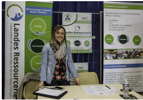
Stand de Landes Ressourcerie