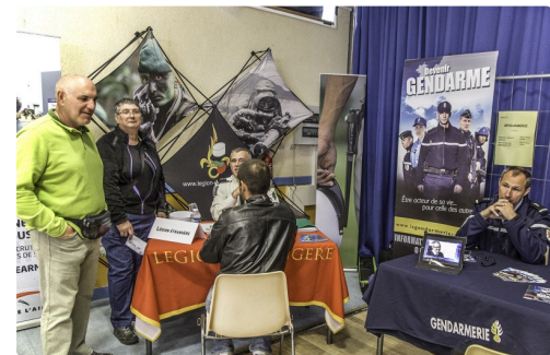
Stand de la Légion étrangère et stand de la Gendarmerie