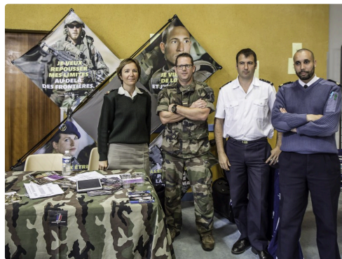
Le stand Armée de Terre et Marine nationale