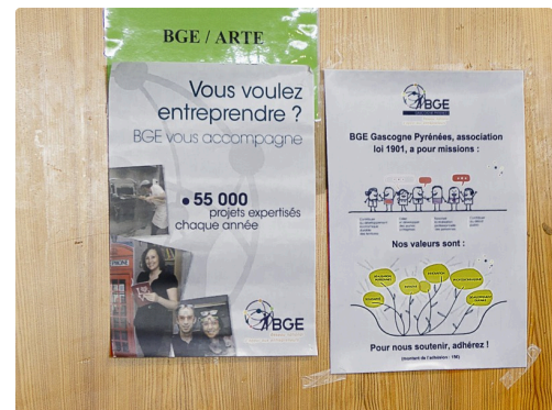
Affiches du stand BGE-Arte qui, notamment, aide à la création d'entreprises