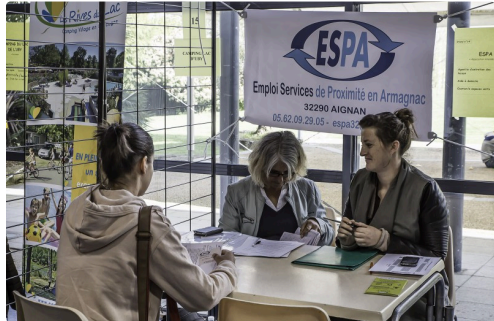
Stand de l'Espa