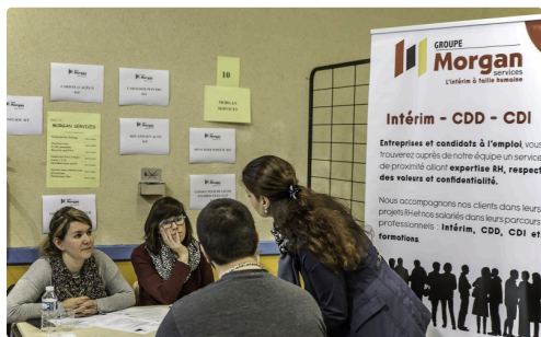
Stand du Groupe Morgan