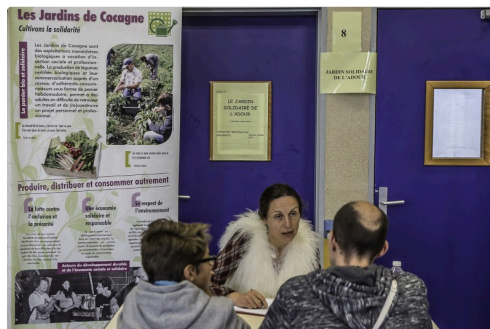
Stand du jardin solidaire de Cahuzac-sur-Adour