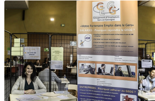
Stand du Groupement d'employeurs Gers en Gascogne