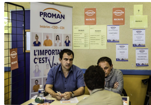
Stand de Proman