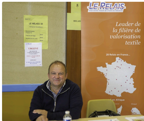
Stand du Relais (textiles récupérés)