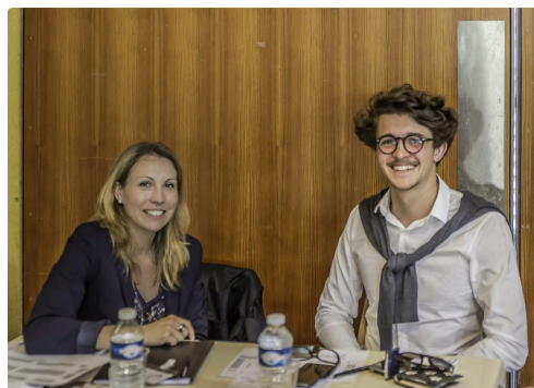
Stand de la Chambre de commerce et d'industrie et de la Chambre des métiers