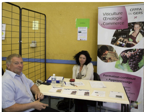
Stand du Ceppa (formation agricole en alternance)