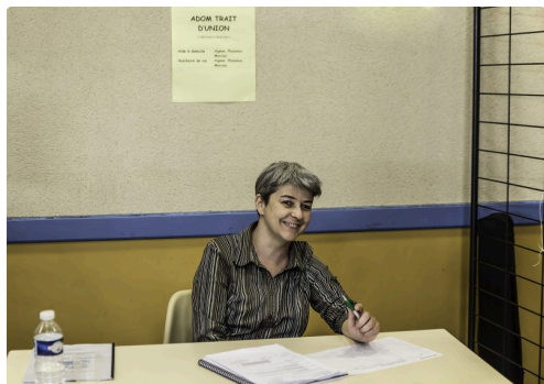
Stand très spartiate de l'Adom-Trait d'union