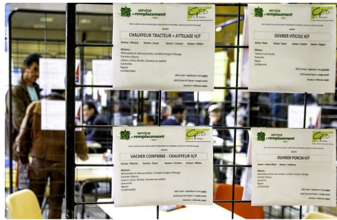
Exemples d'offres d'emploi