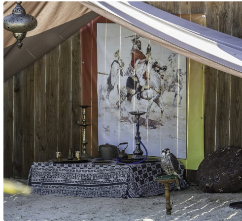
Le prince des rapaces dans sa tente