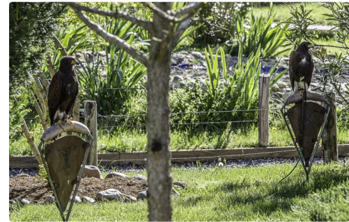
Dans le parc