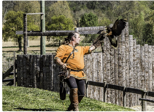
Retour sur le poing du fauconnier