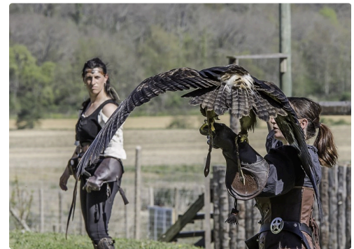
Laïka, aigle des steppes, de dos