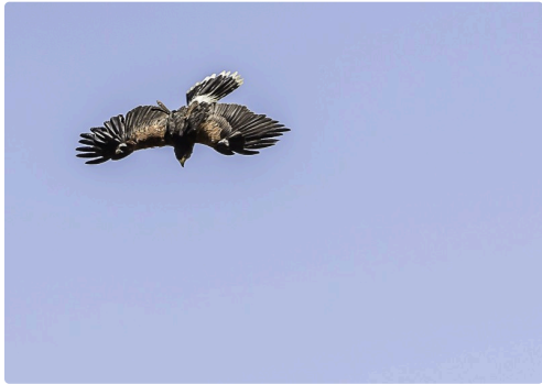
Pirate, buse de Harris