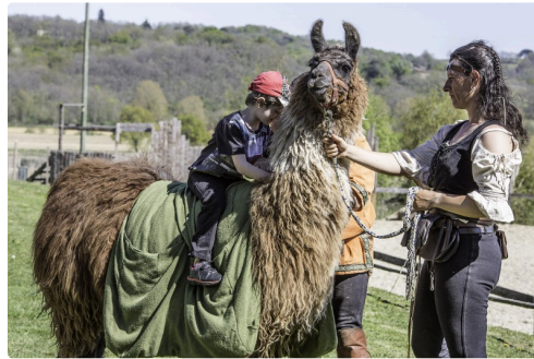
Béregère avec Pichou, le lama