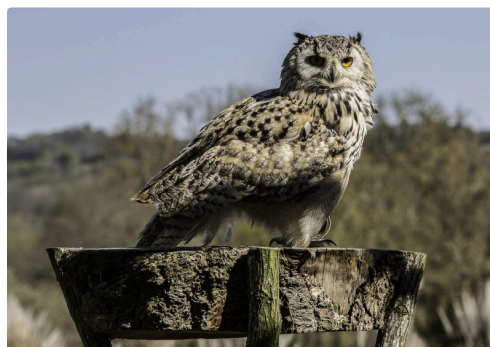
Sloven, grand duc de Sibérie