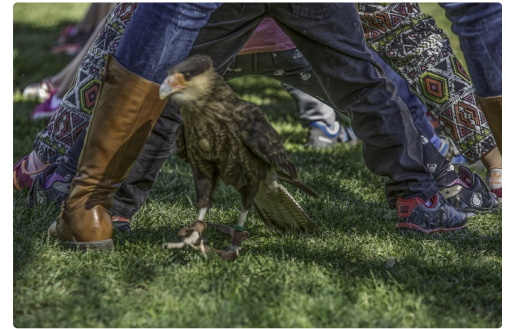
Paco, le caracara huppé passe sous le tunnel en poursuivant une boulette de viande