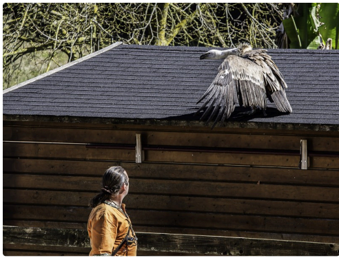
Séquence avec Hourouk, vautour fauve