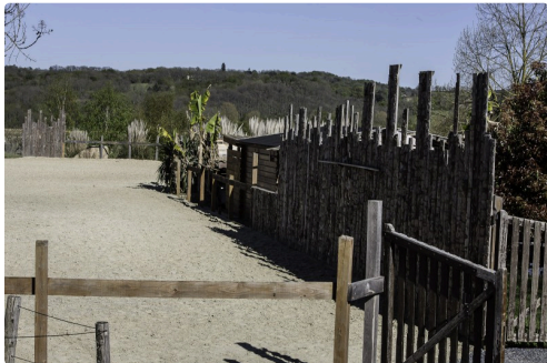
Une partie de l'aire d'évolution des rapaces