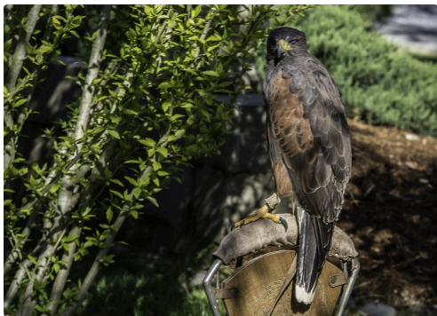
Dans le parc