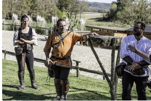
Une partie de l'équipe