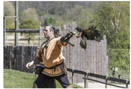
Lancement de Thor, buse de Harris