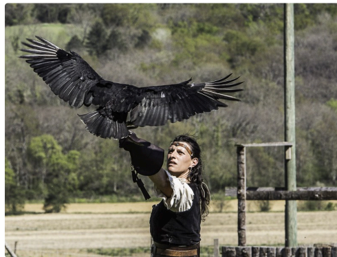
Béregère avec Bubu