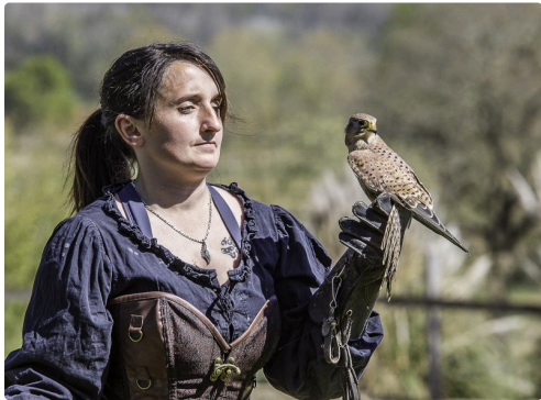
rédiérique avec Fredon, faucon crécerelle