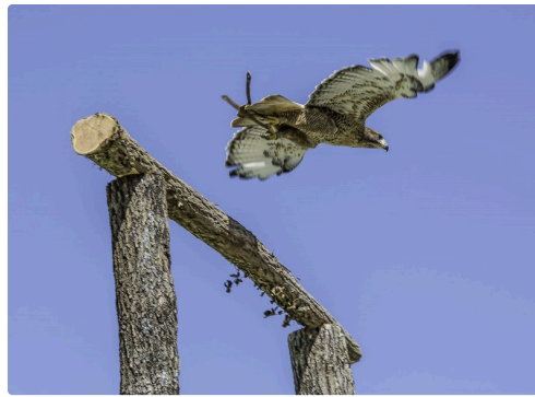
Tara, en vol