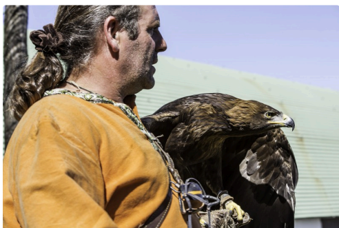
Valéry ave Altion, aigle royal