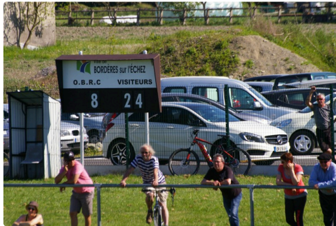
Douze photos