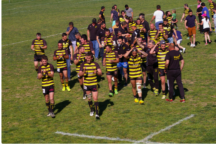
Echos de l'U S Plaisance Rugby

Victoire des "Jaune et Noir" à Bordères : Avec O R B C les compteurs sont remis à zéro