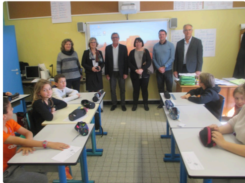
Les intervenants à l'inauguration du tableau numérique