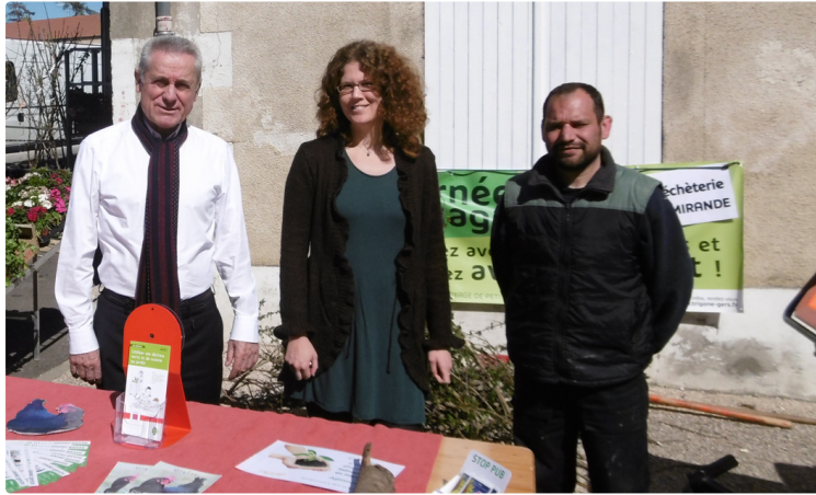
Broyer plutôt que brûler

Trigone travaille à la valorisation des déchets verts