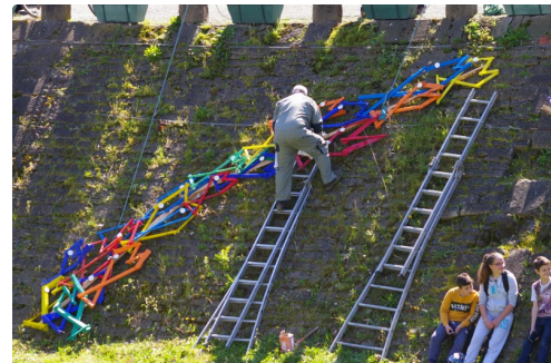
Dix photos Marcel Lavedan droits réservés pour le texte également , pas de copie sur Facebook autorisée