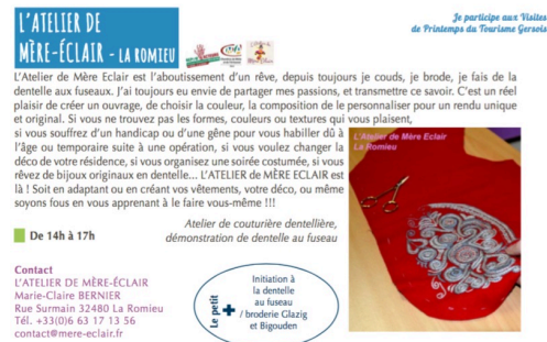
atelier me-re eclair vendredi 7.jpg

Pour plus d'information et le programme complet: http://www.tourisme-gers.com/gers-tour/2017/actu/visites-printemps-tourisme-destination-Gers2017.pdf