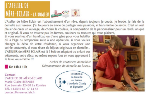
atelier mere eclair dimanche 9 avril.jpg