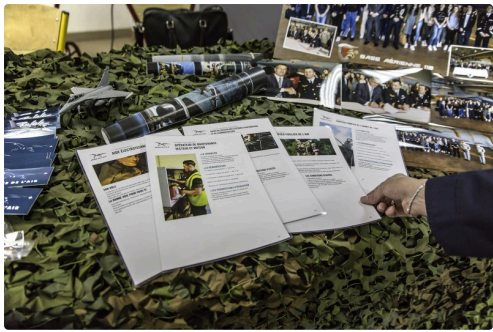
Des fiches claires sur les métiers de l'Armée de l'Air et des photos de la visite à la Base