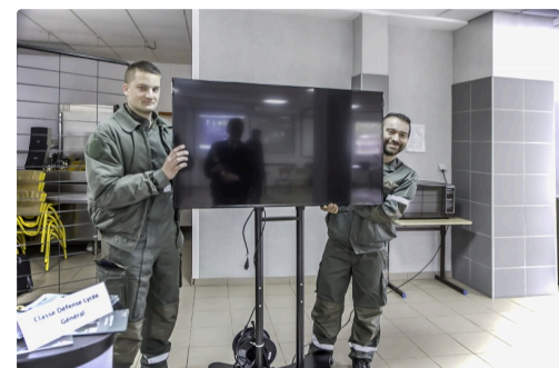
2 mécaniciens sont venus de la Base