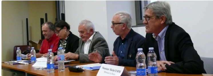
Vic-Fezensac : L'association Tempo Latino a tenu son assemblée générale

L'année 2016 n'amène que des satisfactions, ce qui est de bon augure pour l'édition 2017