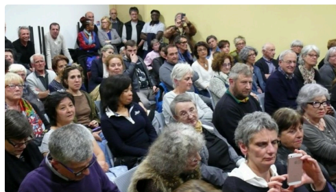
... devant les nombreux bénévoles.