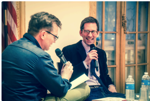
Au consulat a New-York mardi dernier