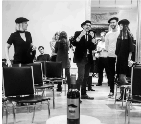
Des Plaisantins supporter