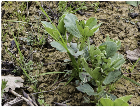
Féveroles récemment plantées dans la vigne en inter-rangs