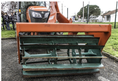
Rouleau pour couper les tiges d'herbes en plusieurs morceaux