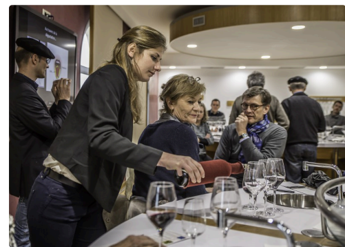
La dégustation va commencer