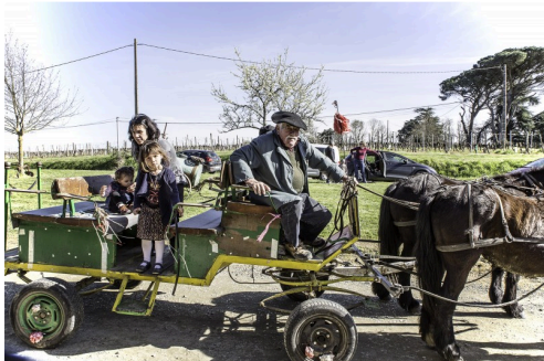
Balade en calèche à Saint-Gô