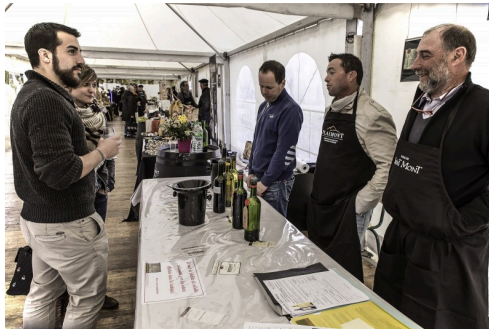
Clients sous les chapiteaux à Saint-Mont