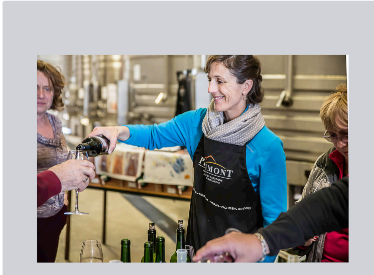
Saint-Mont vignoble en fête

Album de promenade d'un village à l'autre