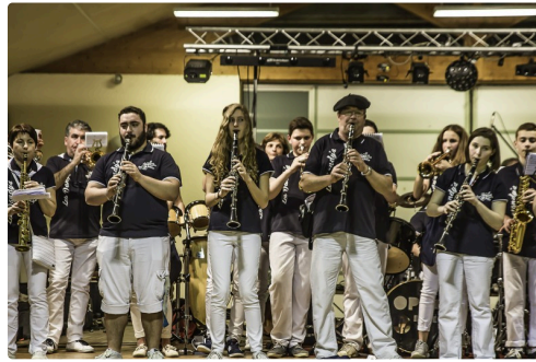
Autre partie des Dandy's à Aignan