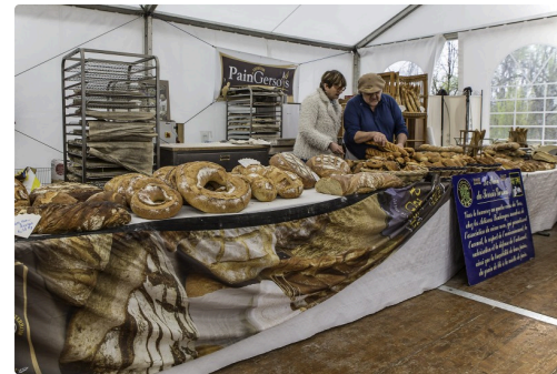
L'étal d'un boulanger à Saint-Mont