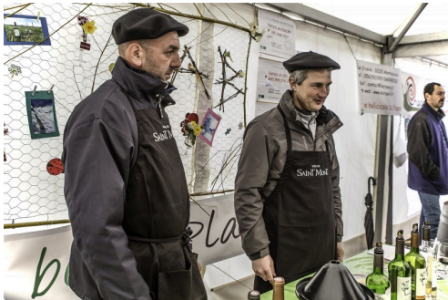
Le stand de vin bio à Saint-Mont