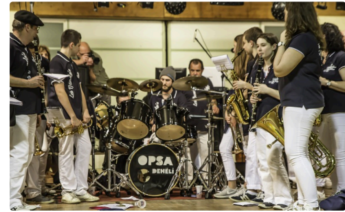
Les Dandy's et Opsa Behéli au Nocturne d'Aignan