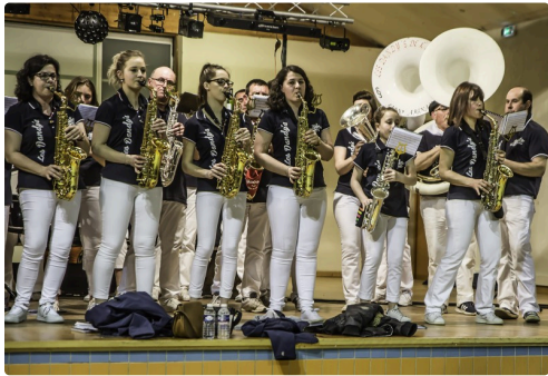
Les Dandy's au Nocturne d'Aignan