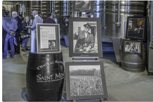
Hommage à Jean-Pierre Coffe à Saint-Gô