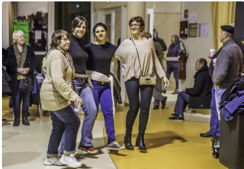
Des spectatrices dansent sur la musique des Dandy's à Aignan