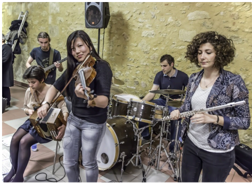
Un premier groupe chauffe la salle à Lupiac