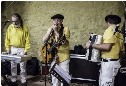
Irish Music lui succède