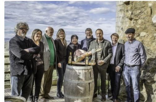
Les participants de la table ronde à la Tour de Termes-d'Armagnac