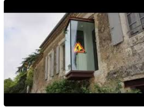
Saint Clar - Médiathèque : Gruissan - Saint-Clar, une histoire de cœur..

Exposition de photos de Gruissan : vernissage jeudi 30 mars à 18h30