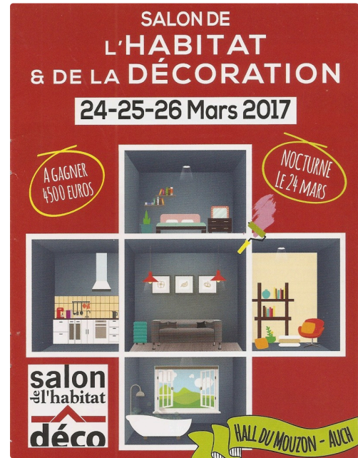
l'affiche du salon