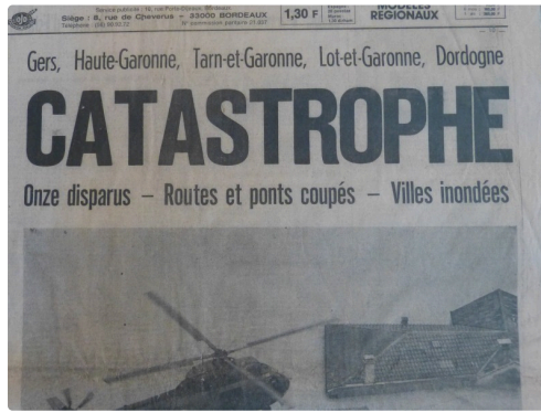
1977-2017 40 ans cette année. Exposition au premier étage du Mouzon.