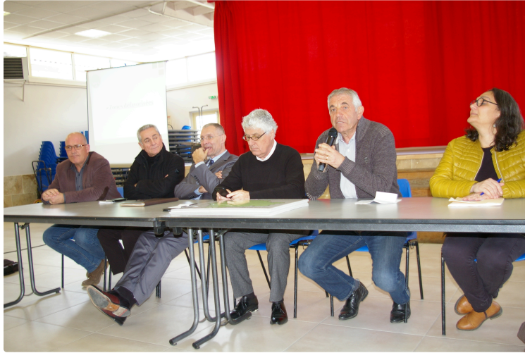
Indemnités Compensatoires d'Handicaps Naturels

Jeudi après-midi, dans la salle des fêtes de Beaumarchès se tenait une réunion d'informations sur les zones dans le Gers qui bénéficient de l'Indemnité Compensatoire de Handicaps Naturels (ICHN) .