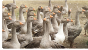
Influenza aviaire : Une première zone stabilisée

Comme annoncé le 20 mars par Stéphane Le Foll, Ministre de l'agriculture, de l'agroalimentaire et de la forêt, le nombre de nouvelles suspicions du virus de l'influenza aviaire hautement pathogène (H5N8) en net recul ces deux dernières semaines, laisse augurer de l'extinction prochaine de l'épizootie. (cf communiqué ci-joint).