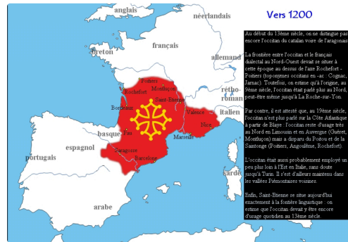
Aire d'usage supposée de la langue d'oc vers 1200

Voilà en quoi la "Croisade des Albigeois" a scellé le destin des Toulousains, en quoi la défaite Aragonaise a éloigné Toulouse des Catalans pour les rapprocher jusqu'à aujourd'hui des Français. Voilà comment les habitants du Comté de Toulouse, du "Pays de Langue d'oc", donc "les Occitans", sont devenus sujets du Roi de France au 13ème siècle, tandis que au Sud des Pyrénées, les Catalans restaient sujets du Roi d'Aragon. Ironie de l'Histoire quand on songe au paradoxe que le mot "Catalogne" vient du latin "Gothalonia", "Pays des Goths", dont la toute première capitale fut Toulouse !