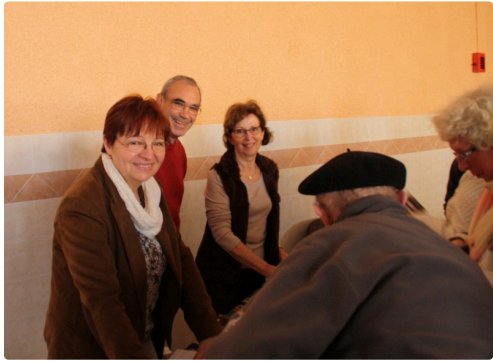
Les éditions du Val d'Adour