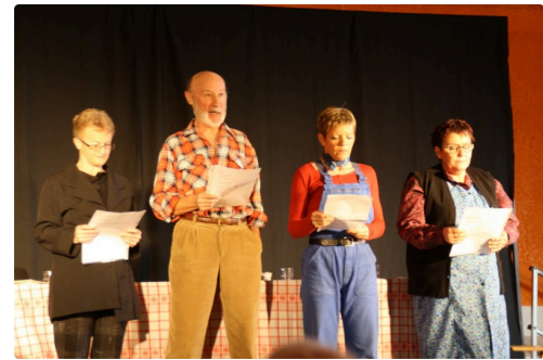
La troupe Les Victambules