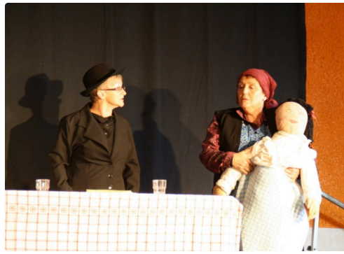
Scène de "Paroles de Marius"