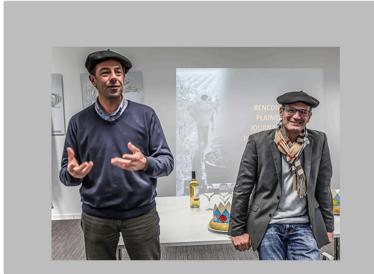
Plaimont Producteurs en forme pour « Horizon 2020 »

L'assemblée générale enregistre les succès