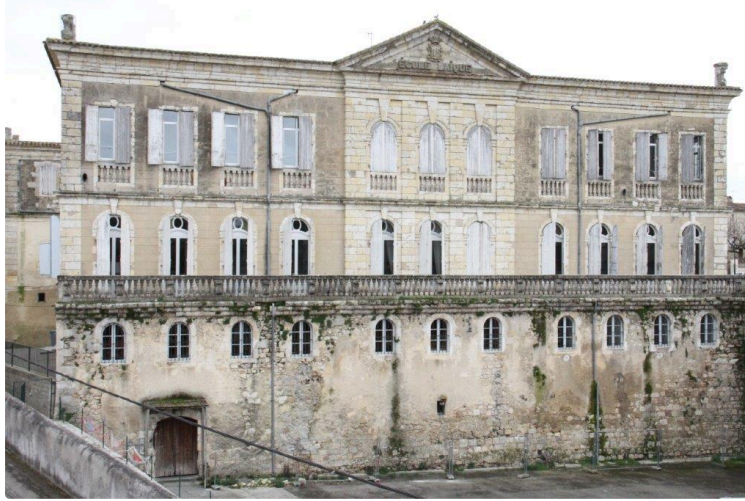
Condom : Restauration de l'hôtel de Polignac

Un appel aux mécènes est lancé via la Fondation du Patrimoine