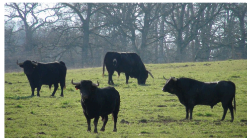
Toros de Darré :Camino,de Santiago