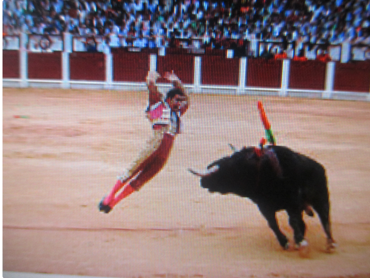
Aignan y toros