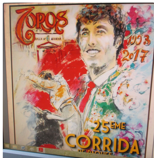
Affiche d'Yves Duffour (Lupiac)