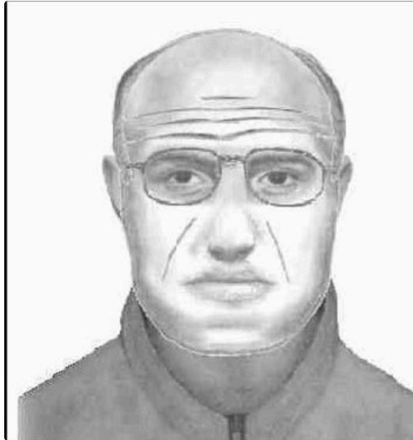
Avis de recherche