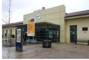
Du nouveau en gare d'Auch

Un vélo écolo high tech oeuvre pour votre santé et l'environnement